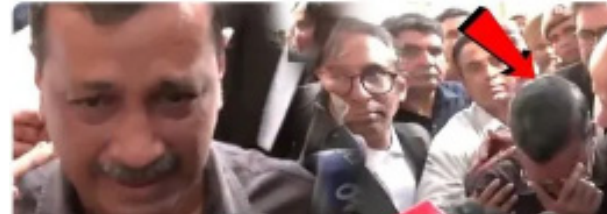
నా జీవితంలో ఎన్నడూ తప్పు చేయలేదు. కేవలం విపక్షాలపైనే ప్రధాని మోదీ దృష్టి పెట్టారు. ప్రజా సమన్వయం మోదీ పట్టించుకోరు.

న్యూఢిల్లీ, ఫిబ్రవరి 27: ఢిల్లీ మద్యం పాలసీ కేసులో ఢిల్లీ మాజీ ముఖ్యమంత్రి అరవింద్ కేజ్రీవాలకు భారీ ఊరట లభించింది. సీబీఐ కోర్టు ఈ కేసునుంచి కేజ్రీవాలను డిస్కార్డ్ చేసింది. శుక్రవారం ఢిల్లీ మద్యం పాలసీ కేసుపై ది రౌస్ అవెన్యూ కోర్టు విచారణ జరిపింది. సీబీఐ వేసిన చార్జ్ షీట్లో మెరిట్ లేదని కోర్టు పేర్కొంది. ఢిల్లీ మాజీ ముఖ్యమంత్రి కేజ్రీవాలతో పాటు ఉప ముఖ్యమంత్రి సిసోడియాకు కూడా క్లీన్ చిట్ ఇచ్చింది.