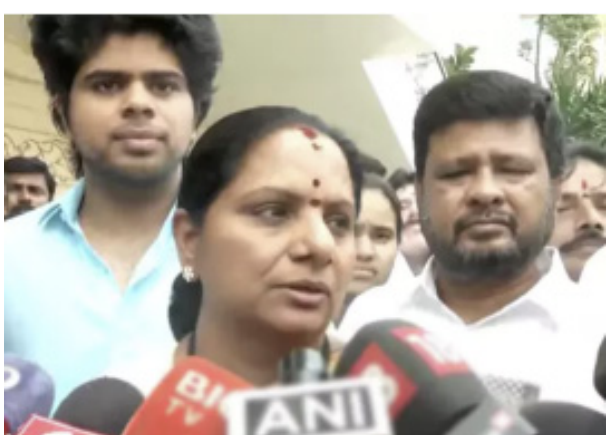
హైదరాబాద్: న్యాయవ్యవస్థపై తాను పెట్టుకున్న నమ్మకం నిలబడిందని తెలంగాణ జాగృతి అధ్యక్షురాలు, మాజీ ఎంపీ కవిత

అన్నారు. ఆమె నిందితురాలిగా ఉన్న దిల్లీ మద్యం కేసు ను కోర్టు కొట్టి వేసిన నేపథ్యంలో హైదరాబాద్ లో మీడియాతో మాట్లాడారు. “నేను కడిగిన ముత్యంలా బయటికి వస్తానని తెలంగాణ ప్రజలకు మెదట్టుంది చెబుతున్నాను. అలాగే వచ్చాను. ఇది కేవలం రాజకీయ కక్షతో పెట్టిన కేసు అని ఎన్నోసార్లు చెప్పాను. అదే నిజమైంది.