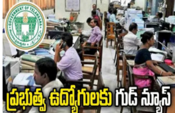
ప్రభుత్వ ఉద్యోగులకు గుడ్ న్యూస్

హైదరాబాద్: రాష్ట్ర ప్రభుత్వ ఉద్యోగులకు తెలంగాణ ప్రభుత్వం తీవ్ర కబురు అందించింది. గత కొంతకాలంగా పెండింగ్లో ఉన్న ఉద్యోగుల ఆర్థిక బకాయిల విషయంలో డిప్యూటీ సీఎం, ఆర్థిక శాఖ మంత్రి మల్లు భట్టి విక్రమార్కు కీలక నిర్ణయం తీసుకున్నారు. శుక్రవారం నాడు ఆయన ఆదేశాల మేరకు ఆర్థిక శాఖ అధికారులు రూ.745 కోట్ల పెండింగ్ బిల్లులను విడుదల చేశారు.