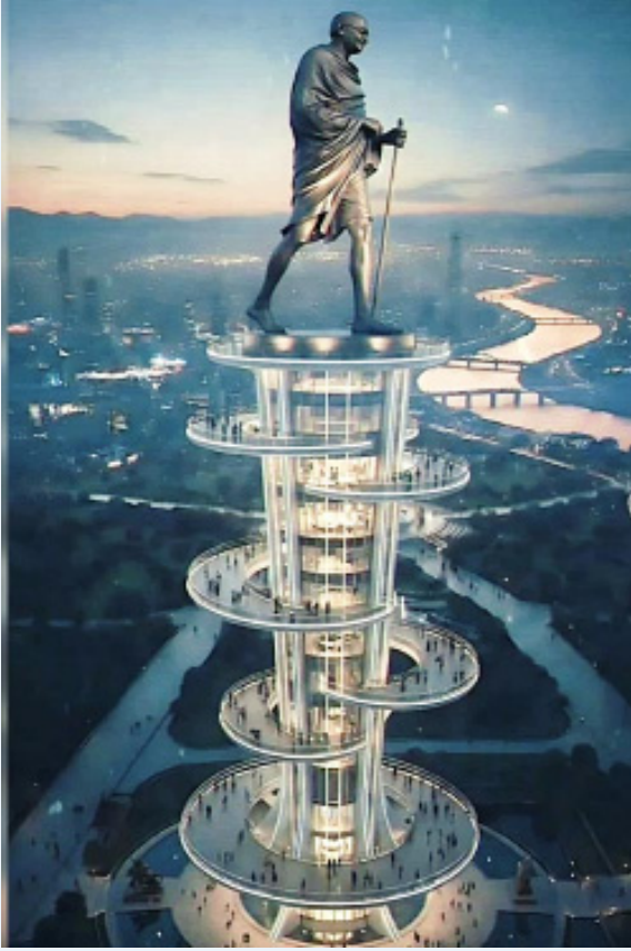
హైదరాబాద్, ఫిబ్రవరి 27, (స్టాన్స్ వర్క్)

హైదరాబాద్ లైఫ్ లైన్ అయిన మూసీ నదికి పూర్వ వైభవం తీసుకురావాలనే పట్టుదలతో తెలంగాణ ప్రభుత్వం 'గాంధీ సరోవర్' అనే ప్రతిష్టాత్మక రిజర్వాయర్ ప్రాజెక్టుకు శ్రీకారం చుట్టింది. బండగూడ ప్రాంతంలో నిర్మించ తలపెట్టిన ఈ ప్రాజెక్టు ద్వారా అటు వరదల ఉధృతిని అరికట్టడంతో పాటు, ఇటు నగరం నడిబొడ్డున పర్యావరణ సమతుల్యతను కాపాడాలని అధికారులు భావిస్తున్నారు. మూసీ సుందరీకరణలో భాగంగా రాబోయే ఈ మార్చి నగర ముఖవిత్రాన్ని మారుస్తుందని ప్రభుత్వం గట్టిగా నమ్ముతోంది. అయితే, మ్యూజ్ గీసిన ఈ ప్లాన్ క్షేత్రస్థాయిలో ఉన్న వేలాది కుటుంబాల గుండెల్లో రైళ్లు పరిగెత్తిస్తోంది. ముఖ్యంగా మధుపార్కీ వంటి కాల్నిలు ఈ ప్రాజెక్టు వల్ల పూర్తిగా తుడిచిపెట్టుకుపోయే ప్రమాదం పొంచి ఉండటంతో స్థానికులు తీవ్ర భయందోళనలకు