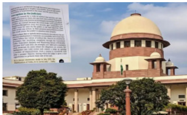
అందరి పేర్లు ఇవ్వండి..

న్యూఢిల్లీ: దేశవ్యాప్తంగా న్యాయవ్యవస్థలో అవినీతి రాజ్యవేలుతోందంటూ వివాదాస్పద వ్యాఖ్యానాలతో రూపొందించిన ఒక చాప్టర్ ముద్రితమైన 8వ తరగతి సాంఘిక శాస్త్ర పాఠ్యపుస్తకంపై సర్వోన్నత న్యాయస్థానం గురువారం నిషేధం విధించింది. భవిష్యత్తులో దేశవిదేశాల్లో ఈ పుస్తకాన్ని పునర్ముద్రించడంగాని ఆన్ లైన్ లో డిజిటల్ రూపంలో అందుబాటులోకి తేవడం లాంటివి చేయకూడదని జాతీయ విద్యా పరిశోధన శిక్షణమండలి(ఎన్సీఈఆర్టీ), కేంద్ర ప్రభుత్వాలను సుప్రీంకోర్టు ఆదేశించింది.